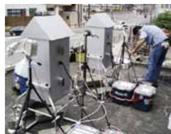
計測現場での作業風景

その後、さまざまなセキュリティ施策を検討した結果、『仮に分解されてハードディスクを取り出されても、データを解読されないことがない』という点において、ハードディスクの全体暗号化が、最もセキュリティ強度が高いという結論に達しました。つづいて、いくつかのハードディスク暗号化製品をリストアップして相互比較を行いました。2008年1月頃のことです」