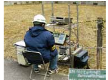
計測現場での作業風景

「かつては、持ち出しPCの盗難・紛失への備えは、現場社員の自覚にのみ頼っていました。しかし CompuSec 導入後は、盗難・紛失が生じた際でも、情報漏えいが生じないことを